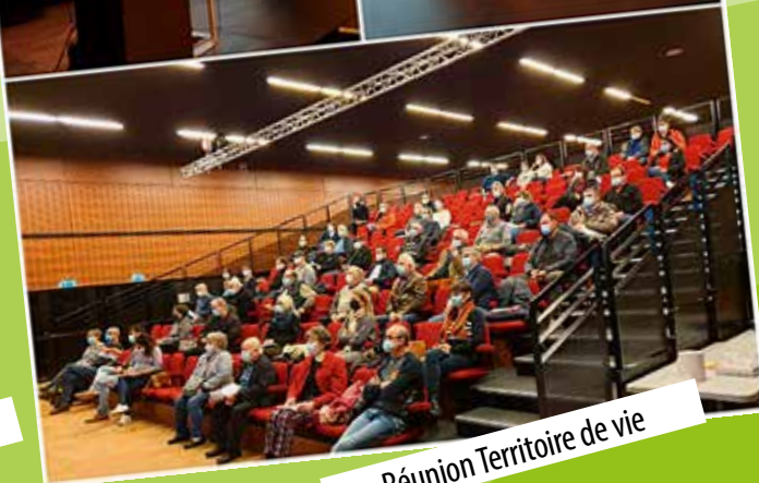
Réunion Territoire de vie