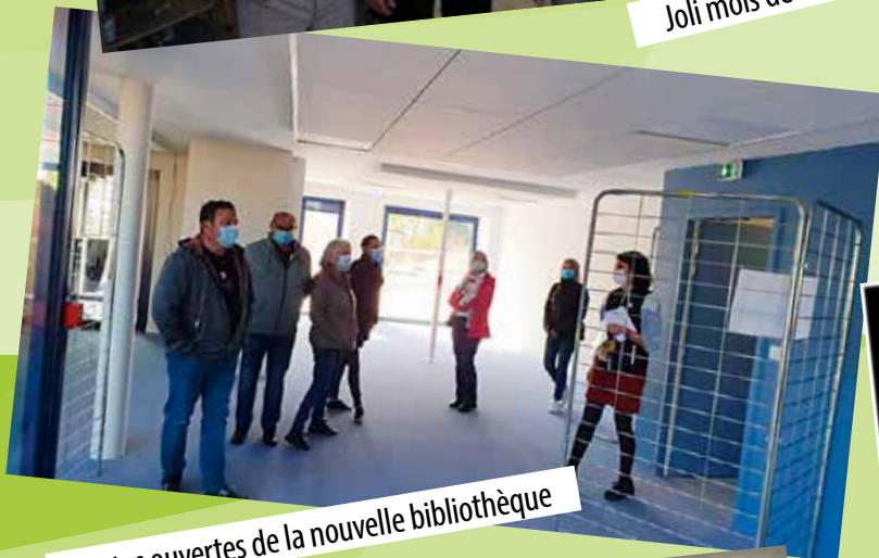
Portes ouvertes de la nouvelle bibliothèque