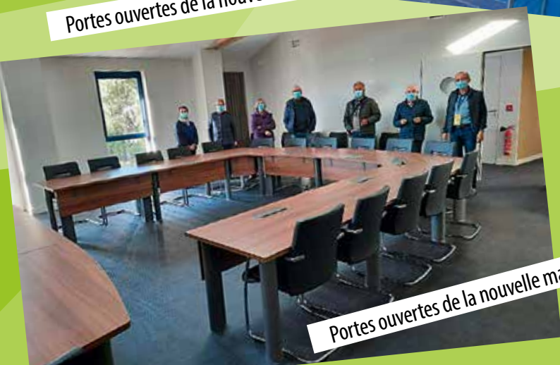
Portes ouvertes de la nouvelle mairie