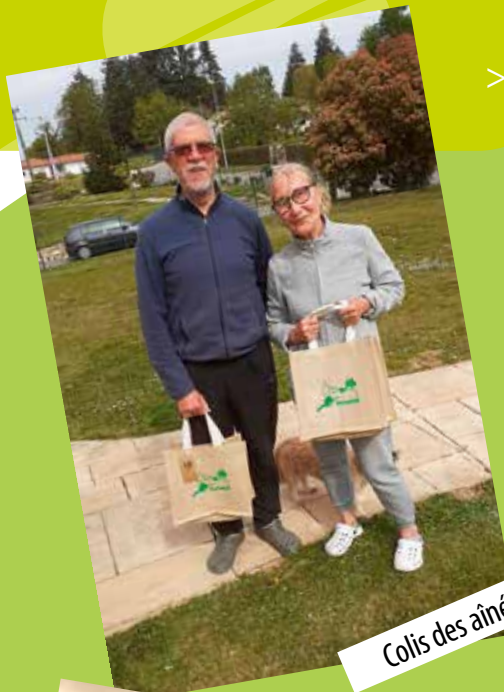
Colis des aînés