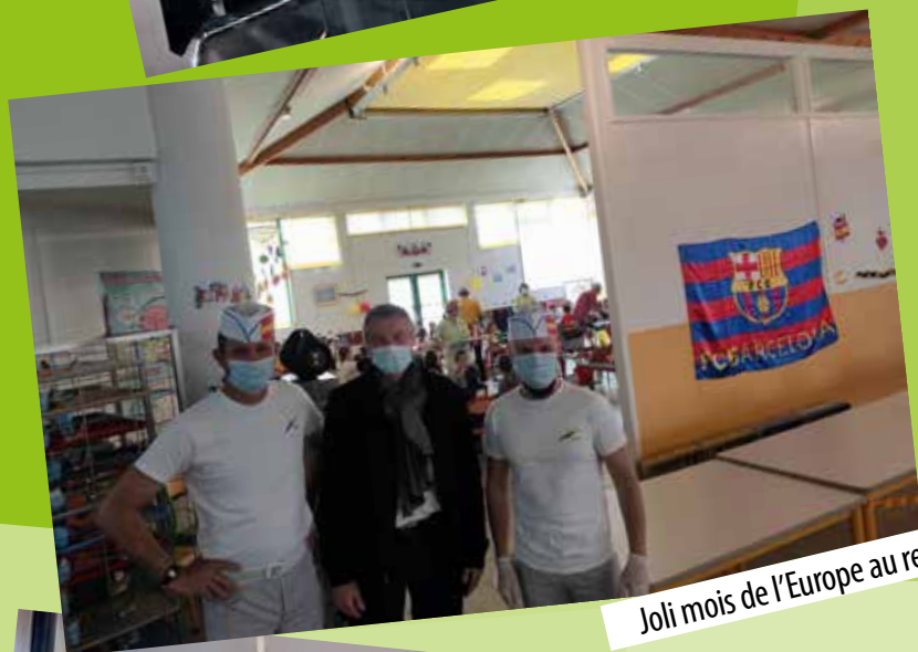
Joli mois de l'Europe au restaurant scolaire