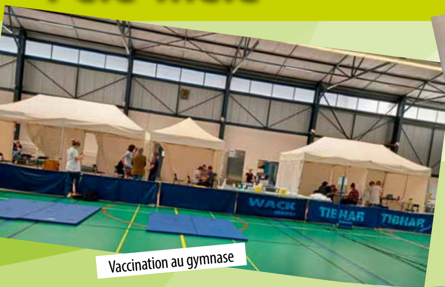
Vaccination au gymnase