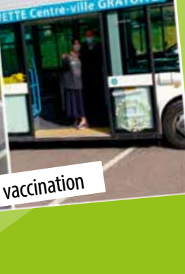
Navette électrique de Limoges Métropole pour la vaccination