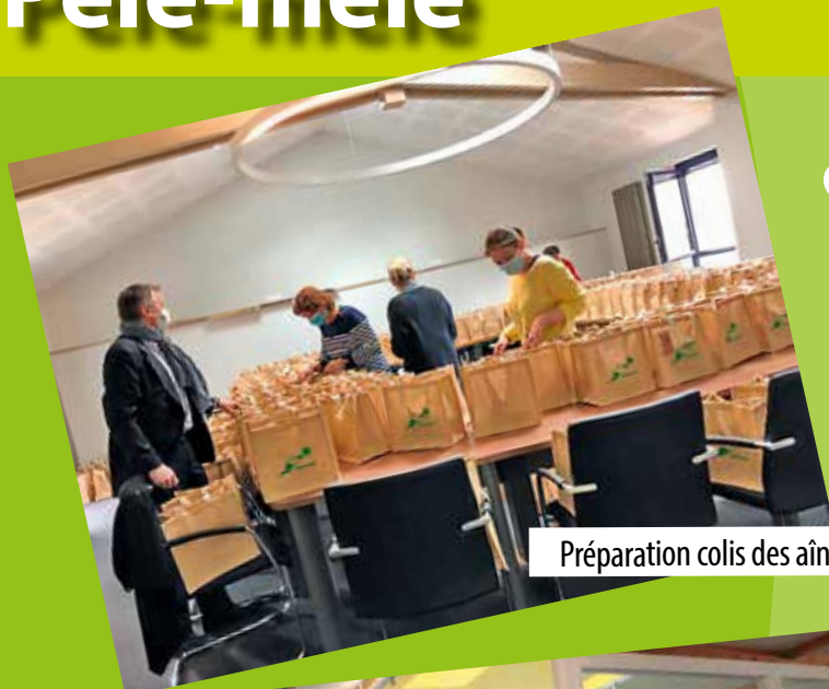
Préparation colis des aînés