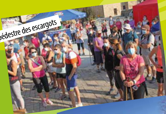
Balade pédestre des escargots