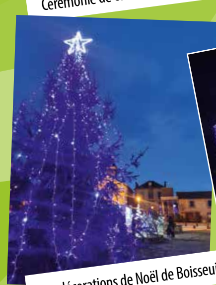
Les décorations de Noël de Boisseuil