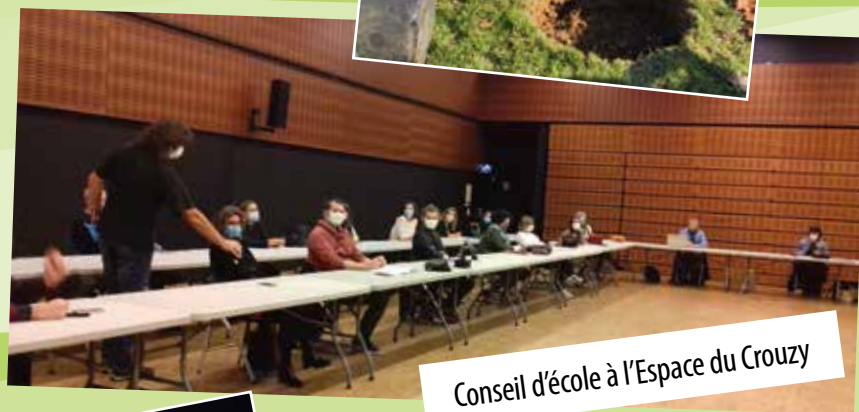
Conseil d'école à l'Espace du Couzzy