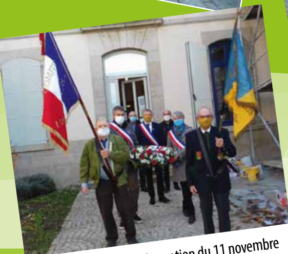
Cérémonie de commémoration du 11 novembre