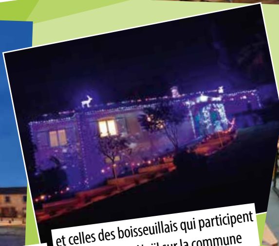
et celles des boisseullais qui participent à l'ambiance Noël sur la commune