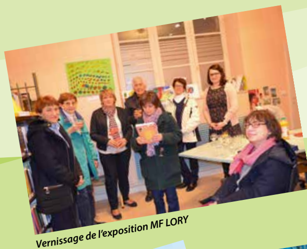
Vernissage de l'exposition MF LORY