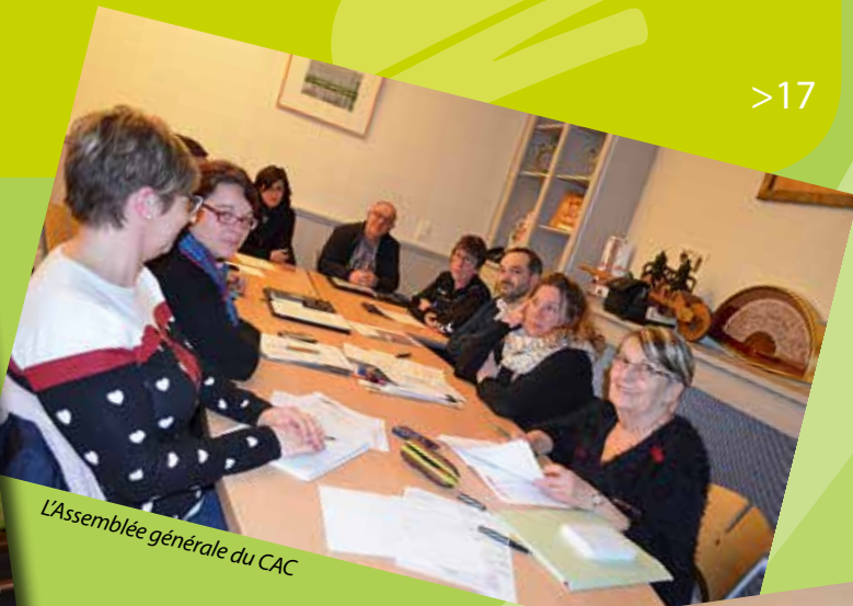
L'Assemblée générale du CAC