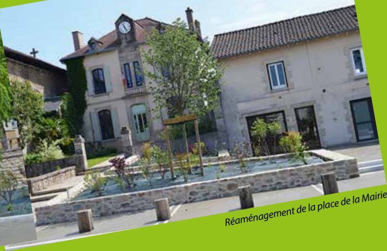
Réaménagement de la place de la Mairie