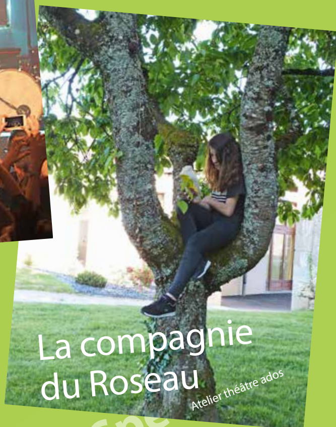
La compagnie du Roseau