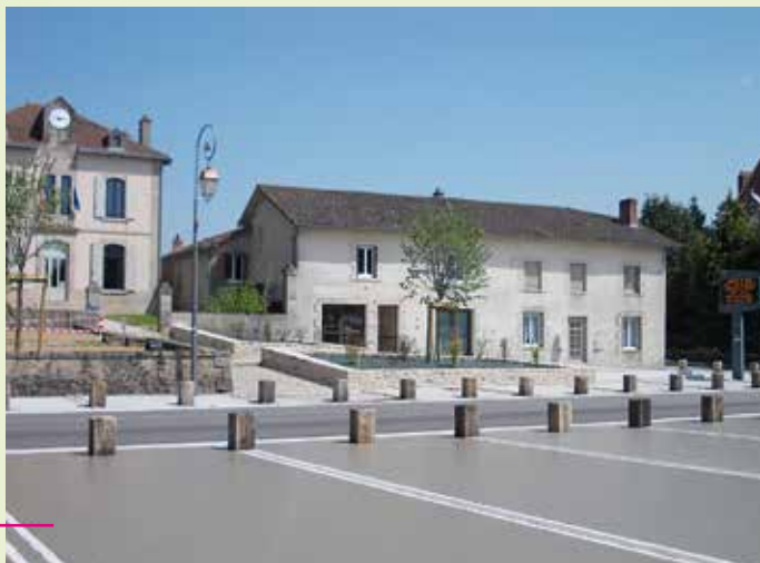
Enrobé de la place et végétalisation du centre bourg (Fin prévue été 2018).