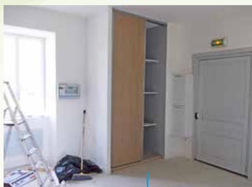
Rénovation du presbytère