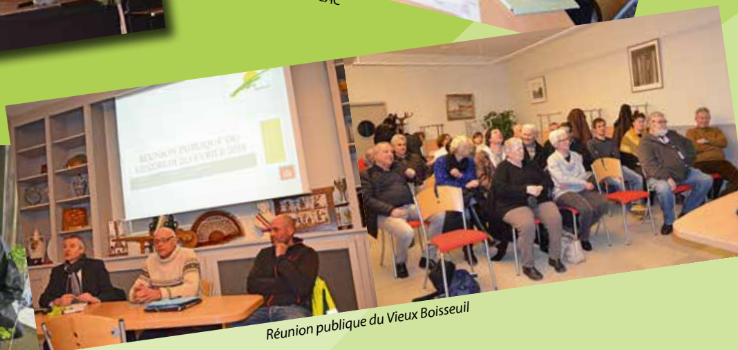
Réunion publique du Vieux Boisseuil