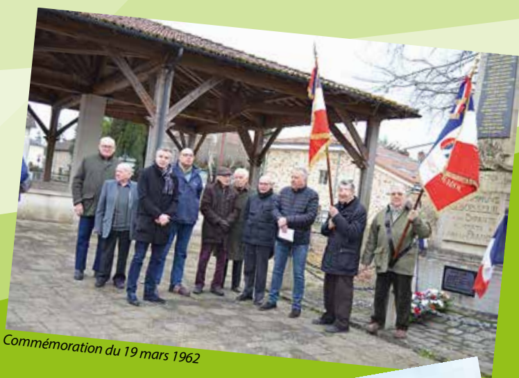
Commémoration du 19 mars 1962