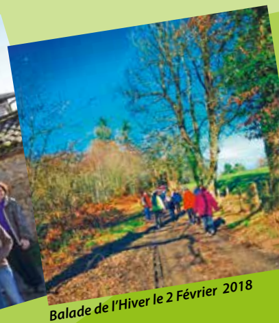
Balade de l'Hiver le 2 Février 2018