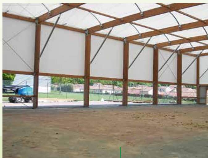
Couverture d'un terrain de tennis