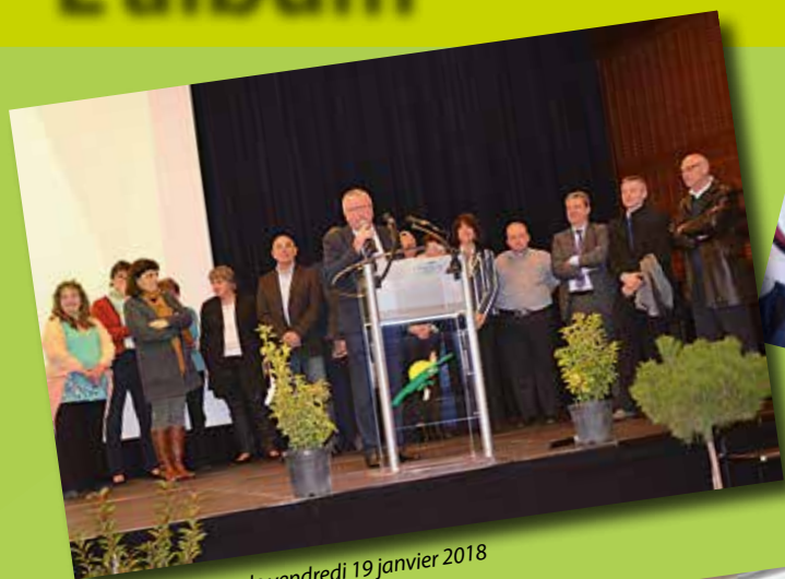
Les vœux du Maire le vendredi 19 janvier 2018