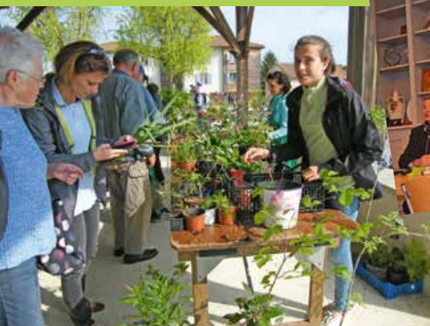
13 e Troc de plantes le 5 Mai dernier