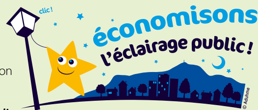
Consommation électrique éclairage public

Une baisse significative de la consommation d'électricité a été constatée du fait de l'extinction de l'éclairage public entre minuit et 5h du matin :