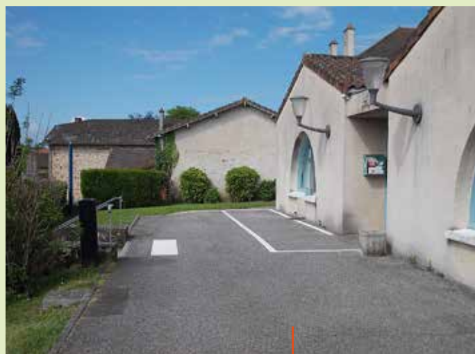
Mise en accessibilité de la salle polyvalente