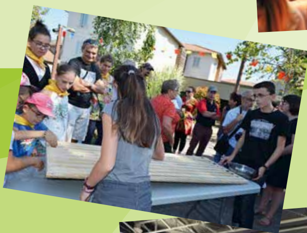
Foire et foulée des Escargots