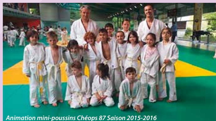
Animation mini-poussins Chéops 87 Saison 2015-2016